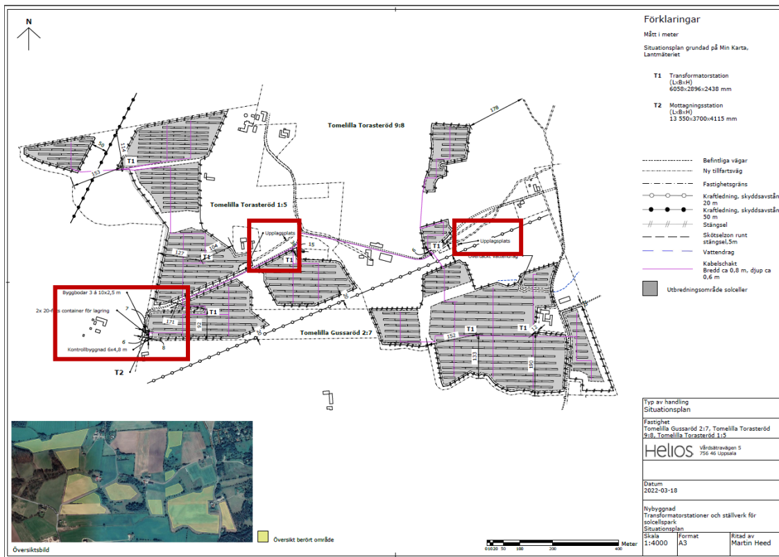
Figur 2. Situationsplan byggbodas och upplag i grundförslag markerat i rött