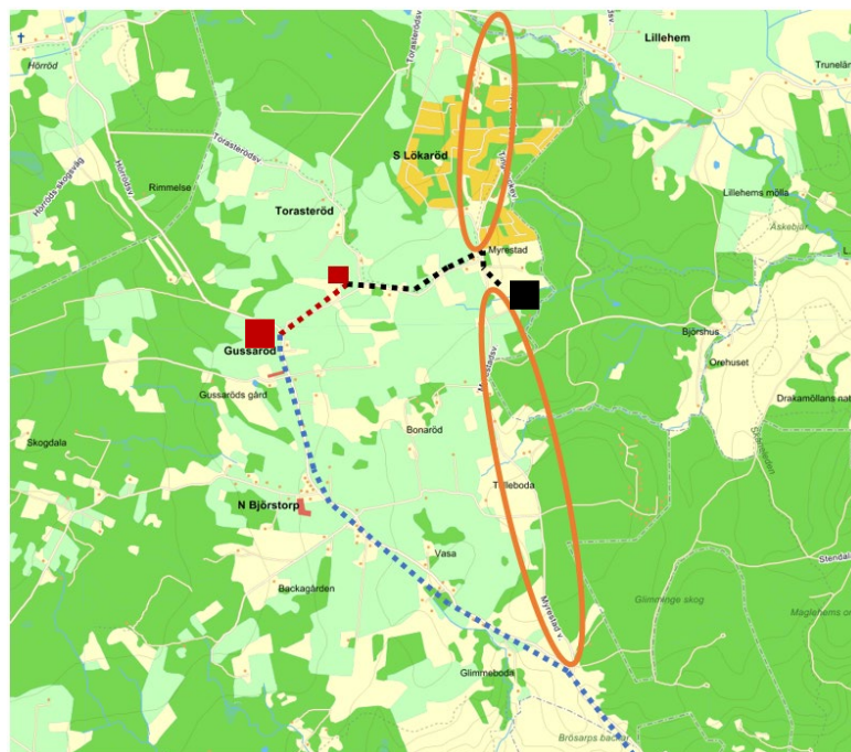
Figur 3. Trafikverkets väg i blått. Väg till upplag, bodar i grundförslag i rött. Förlängning av körväg i nuvarande bygglovsförslag samt förslag på upplag, parkering och arbetsbodas i svart. Myrestadsvägen inringad dels emot Lillehemsvägen dels mot Hörrodsvägen som kan medföra ökad trafikbelastning.